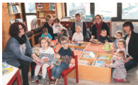
L'activité Bébés lecteurs à la bibliothèque