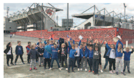
Les jeunes devant le stade du Roudourou à Guingamp