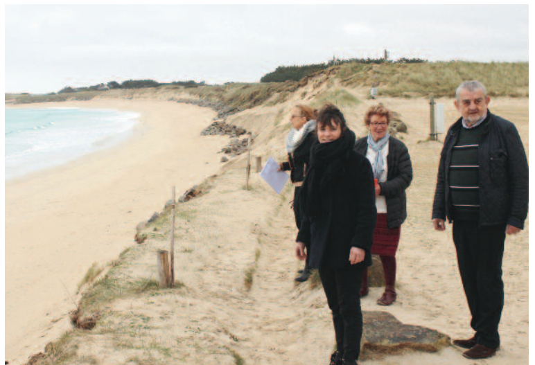
Mme la Députée sur la partie littorale du camping de Roguennic