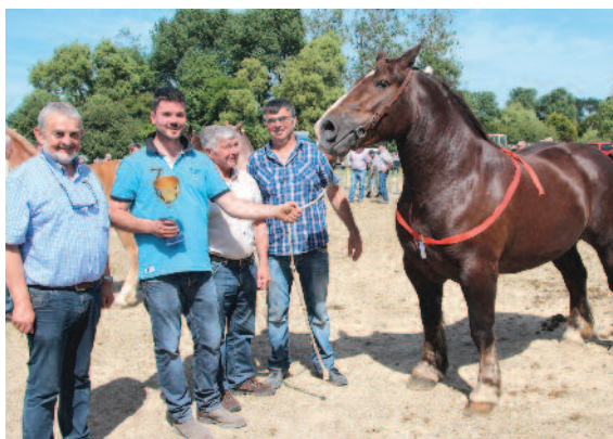
En juin, concours cantonal du Cheval breton

... parmi les images à retenir de l'année 2018