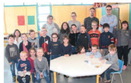
Au Centre de loisirs