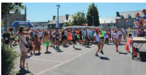
La Clédéroise : de la bonne humeur malgré les embûches !