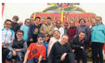
Le Cirque Français à l'école Per-Jakez Hélias