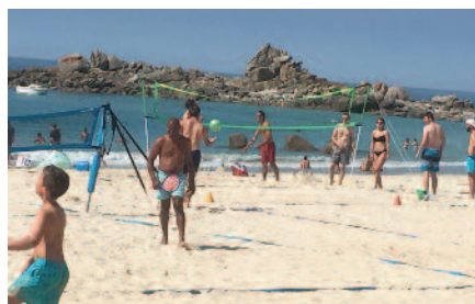
Les mercredis du sport