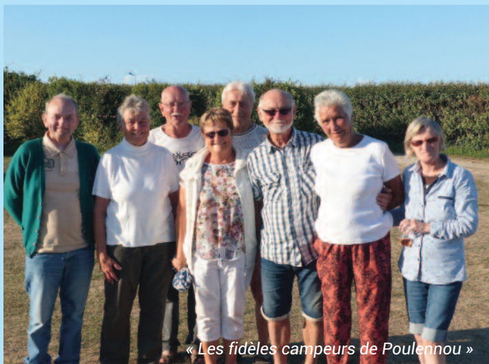
« Les fidèles campeurs de Poulennou »