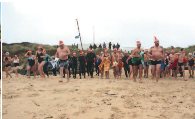
En décembre, le bain de Noël