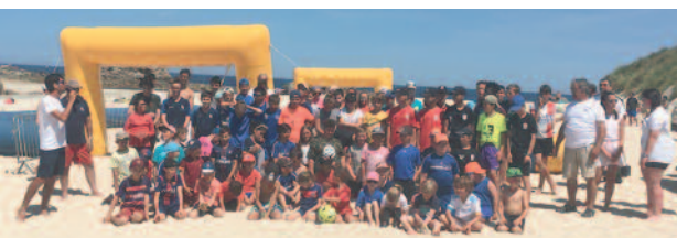
Tournée des plages