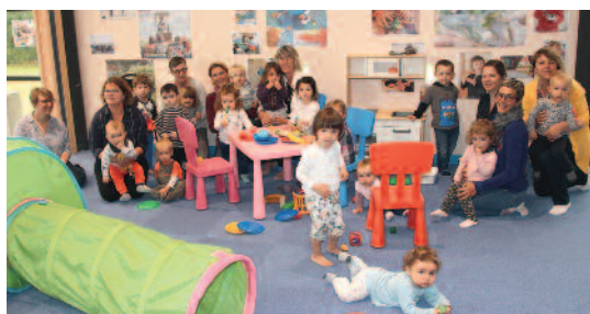
Au Relais petite enfance