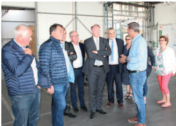
M. le Sous-Préfet lors de sa visite à l'entreprise TECNOSEM